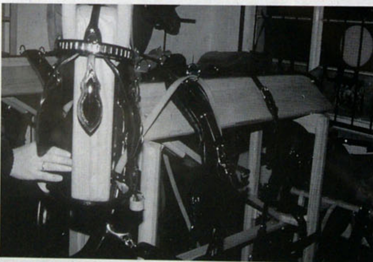
Das Einspänner-Kummet-Geschirr von Rösler Fahrspport, schaut man auf die Details, erkennt man die gute Qualität und Verarbeitung

Und noch Eines fiel auf: Die Edeltahlschnallen besitzen kein Kapploch, an diesem Punkt riß früher das Leder desöfteren ein. Heute ist dadurch die Schnalle aufwendiger, die Verschnalung aber insgesamt wesentlich verbessert und sicherer. Und darum bemühen sich Firmeninhaber und seine Frau im besonderen: Sicherheit und hervorragende individuelle Handwerksqualität. Zu dieser Qualität gehört auch die Füllung der Schweifmetze: Da diese am Pferd unter der Schweifrube immer feucht ist, werden in die Schweifmetze Leinsamenkerne eingearbeitet, die das Leder von innen her ölen und einem vorzeitigen Zerfall vorbeugen helfen.