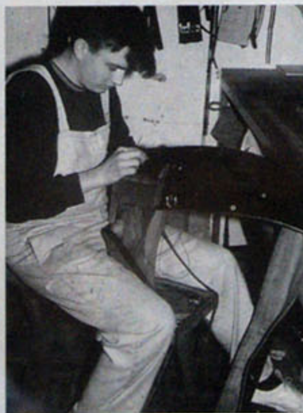
Sattler-Handwerk ist Handarbeit!

Sie arbeitet mit einem Lehrling und zwei Gesellen zusammen. Den Nachwuchs – und darauf legen beide gros-