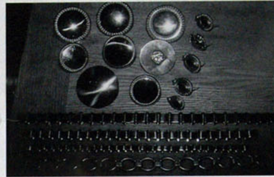
Verschiedenste Rosetten und Stirnketten gehören zum Sortiment bei Rösler Fahrspport